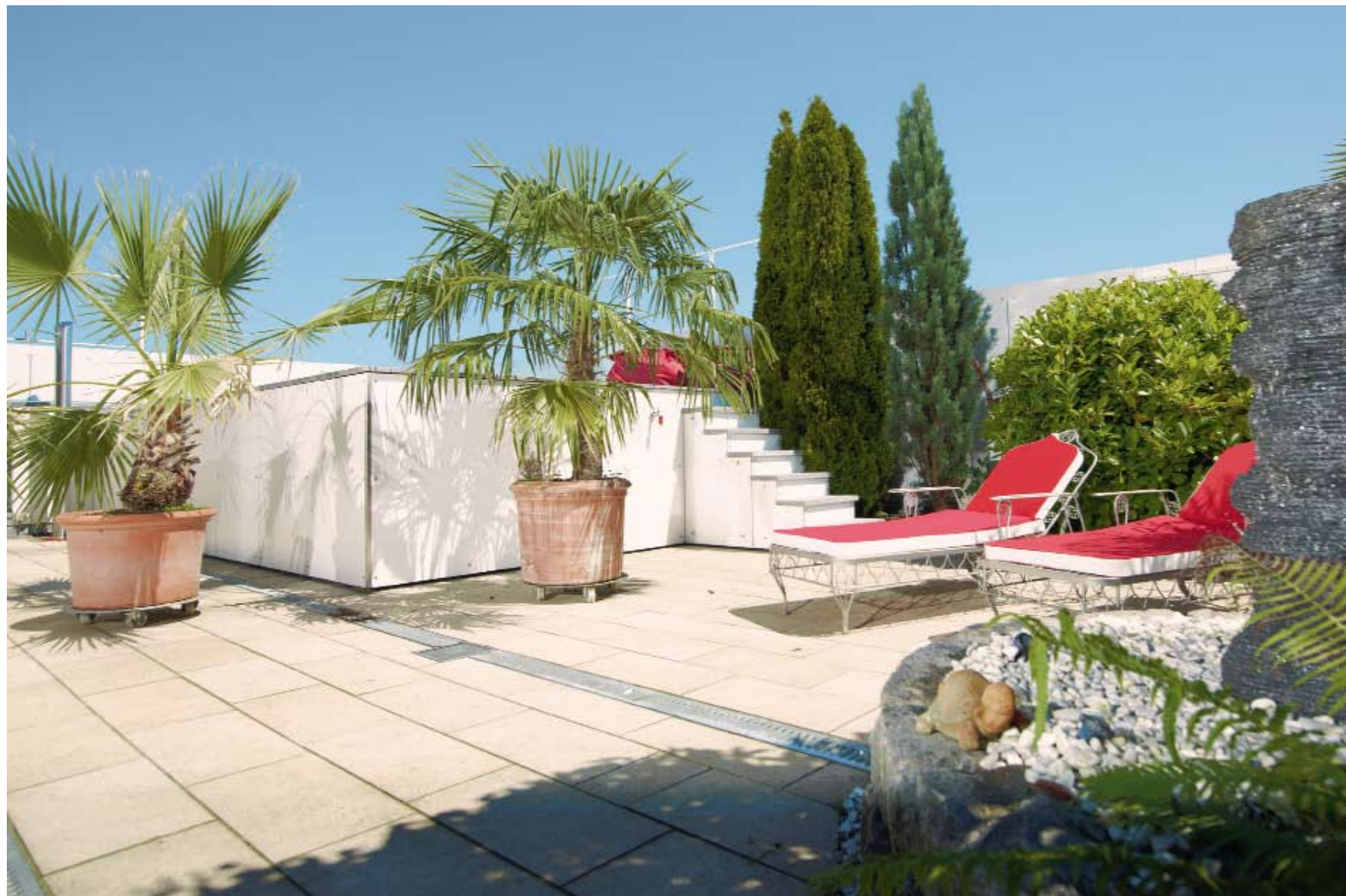
Raustreten und wohlfühlen – der rund 160 Quadratmeter große Dachgarten bietet mit seiner sorgsam arrangierten Bepflanzung und Möblierung Genuss für alle Sinne.

Schon beim Bau des Firmengebäudes mit darüber liegendem Penthouse für den Chef und seine Frau vor gut 15 Jahren war klar: die Dachterrasse muss statisch so ausgelegt sein, dass sie auch das Gewicht eines Pools und eines Saunahauses locker aushält.