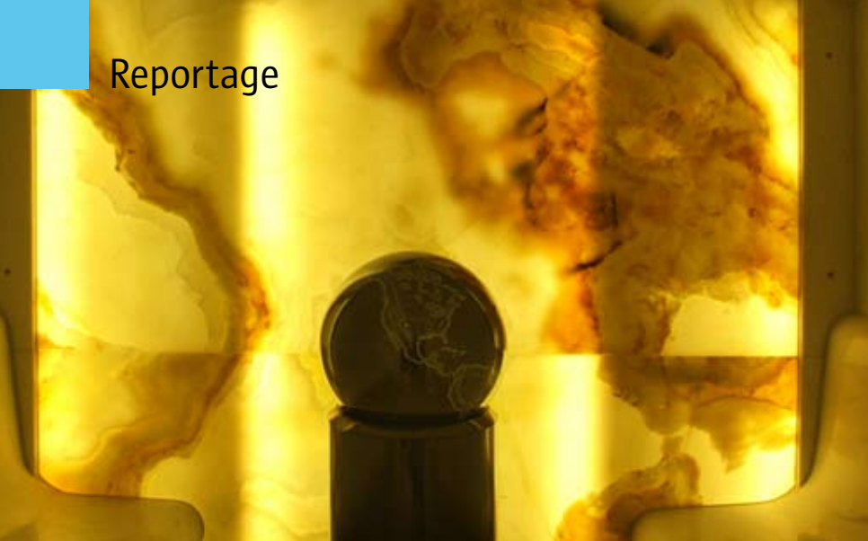
Ein phantastisches Bild bietet der hinterleuchtete Marmor im Dampfbad.