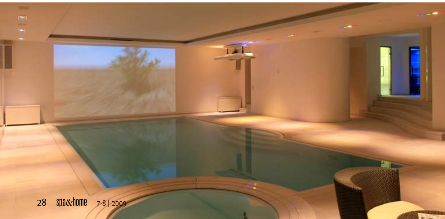
In den Mußestunden stehen die neuesten Filme zur Auswahl.

an einen neuen und größeren Standort zu ziehen, stellte sich die Frage, was mit der freigewordenen Haushälfte geschehen sollte. Verkaufen? Das wollte er nicht, denn wer weiß, was für einen Nachbarn er bekommen würde. Vermieten? Schon gar nicht. So ent-