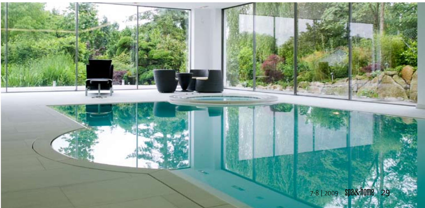
Die breiten Glasfronten holen die üppige Natur in die Schwimmhalle hinein.

wickelte Energiesparschaltung zum Einsatz kommen. Bei Nichtbenutzung des Pools und ausgefahrener Abdeckung wird die Raumtemperatur um ein paar Grad abgesenkt, ohne dass dies zu einer überhöhten