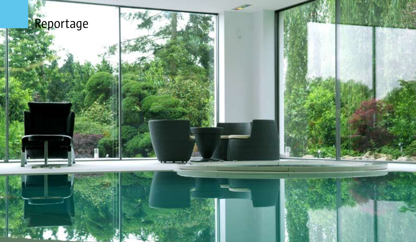
Vom Whirlpool können die Bauherrn sowohl ihr neues Reich überblicken als auch den Ausblick in den Garten genießen.

B eide Doppelhaushälften wurden vom Bauherrn jahrelang selbst genutzt. In dem einen Haus waren seine Privaträume, in dem anderen die Büros seiner Firma. Als er sich nun entschloss, mit seiner Firma