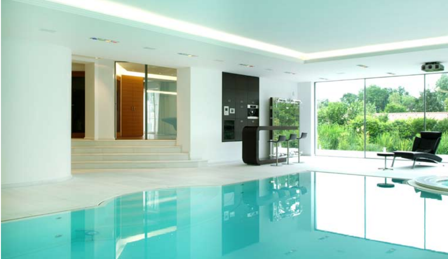
Im Eingangsbereich der Halle ist der Wellnessbereich mit Sauna und Dampfbad untergebracht.

war ihm ebenso wichtig wie der Blick auf den nahegelegenen See. Da das Grundstück leichte Hanglage hat, waren aufwendige Bauarbeiten notwendig, um den Anbau in halber Unterflurbauweise realisieren zu können. Betritt man heute das Badeparadies, so gelangt man ebenerdig zuerst vom neu geschaffenen Wohnbereich in die kleine Wellnessanlage mit einer konventionellen Sauna und einem aufwendig gestalteten Dampfbad. Vor allem die Innenausstattung des Dampfbades ist ein Highlight für sich. Die Kabine mit gewölbter Natursteindecke ist mit hochwertigem Marmor ausgekleidet, der dank der Hinterwand-Beleuchtung